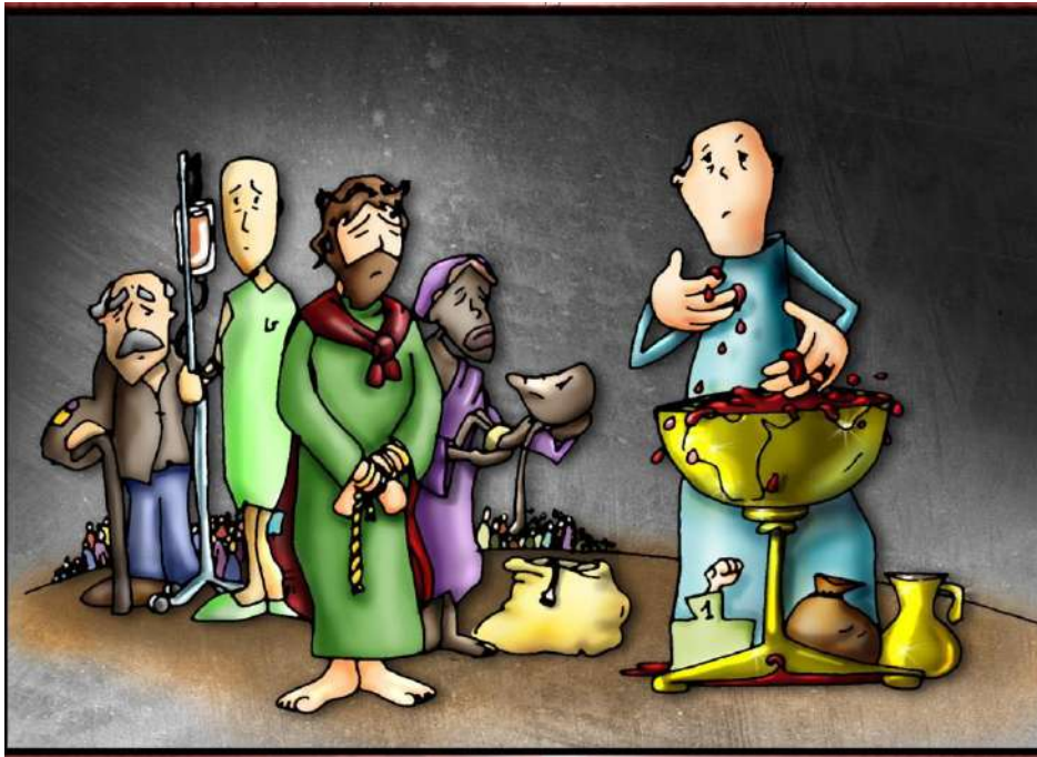
VIERNES SANTO PRETORIO