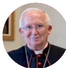
† Antonio Cañizares Llovera Cardenal arzobispo de Valencia

Muchísimas gracias a todos. Que Dios os pague y bendiga, Él siempre paga.