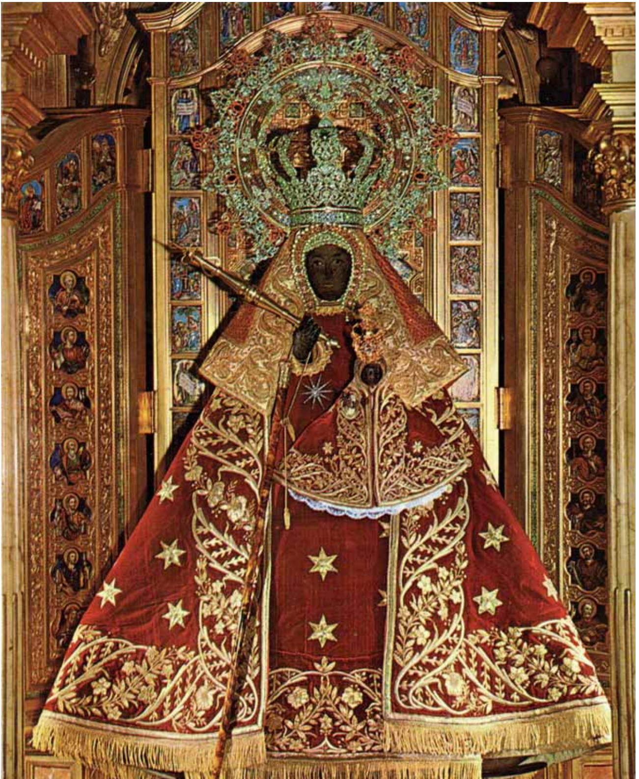
Ntra. Sra. de Guadalupe. Real Monasterio de Santa María de Guadalupe (Cáceres).