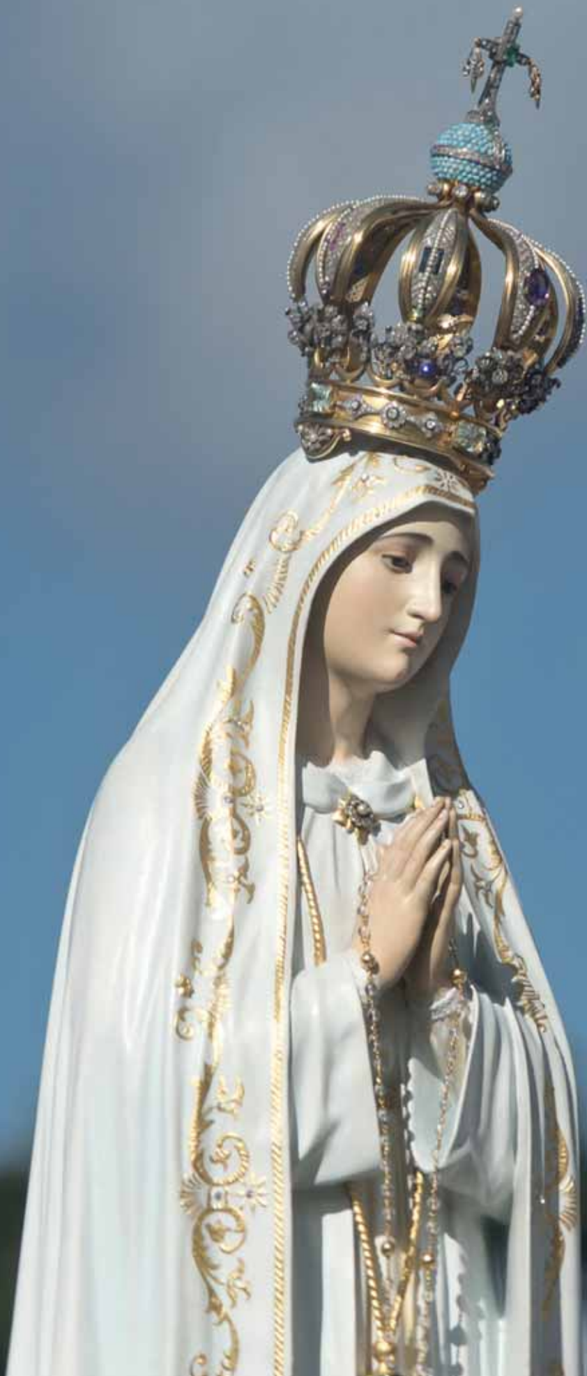
Ntra. Sra. de Fátima. Santuário de Ntra. Sra. de Fátima (Portugal).